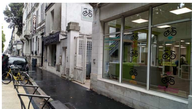
Trop discrète, la maison du vélo est difficile à voir si on ne la connaît pas.

Pour autant, l'accueil Vélo et Rando de Tours Métropole Val de Loire vient d'être primé par Talents du Vélo, le 14 juin 2018. 8