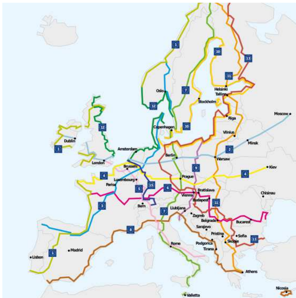
Carte des itinéraires EuroVelo jusqu'en 2016. Eurovelo.org.

A ce réseau, s'ajoutent la vélo-route de St Jacques de Compostelle via Chartres et Tours, le projet de vélo-route Cher à vélo - canal du Berry déjà mis en œuvre de l'entrée de la métropole à Saint-Pierre-des-Corps jusqu'à Montrichard dans le Loir-et-Cher, et enfin la proximité avec l'Indre à vélo, jusqu'à Châteauroux.