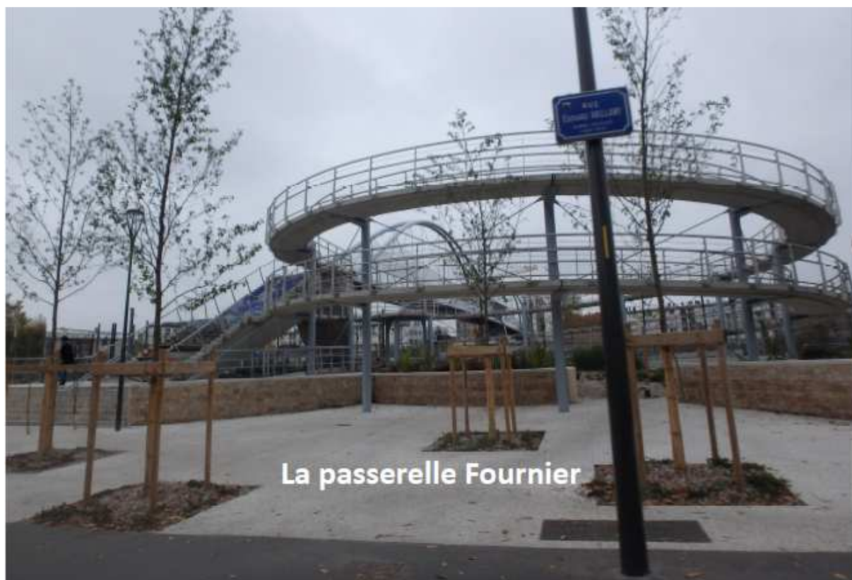
La passerelle Fournier