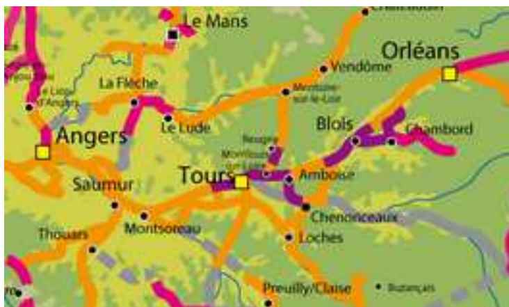
Carte nationale de l'AF3V, association française de développement Véloroutes et Voies Vertes.

Les comptages réalisés évaluent à quelques 65 000 passages annuels sur l'agglomération (Montlouis et Tours) avec une pointe à 94 000 à Savonnières, 6 ce qui éclaire sur les pratiques excursionnistes des Tourangeaux, comparés aux passages enregistrés à Amboise (30.000 ).